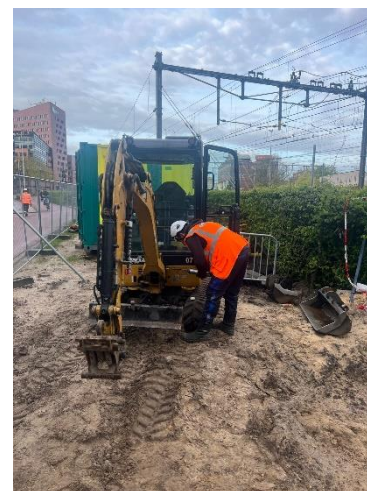
Insmeren van minigravers

Het is zeer belangrijk dat we continue elkaar op de hoogte stellen en aanspreken over de regels. Als het werk niet veilig uitgevoerd kan worden zoals bedacht, ga terug naar je leidinggevende(n) en bepaal een nieuwe werkmethode. We werken veilig of we werken niet